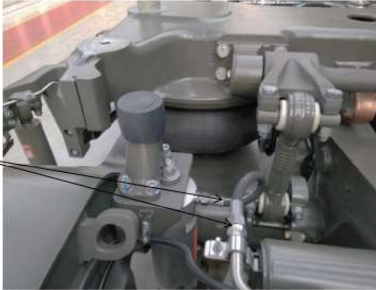
Figure 12 / Figuur 12